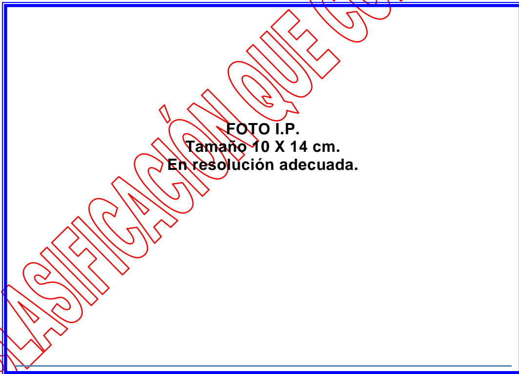
Tamaño 10 X 14 cm. En resolución adecuada.