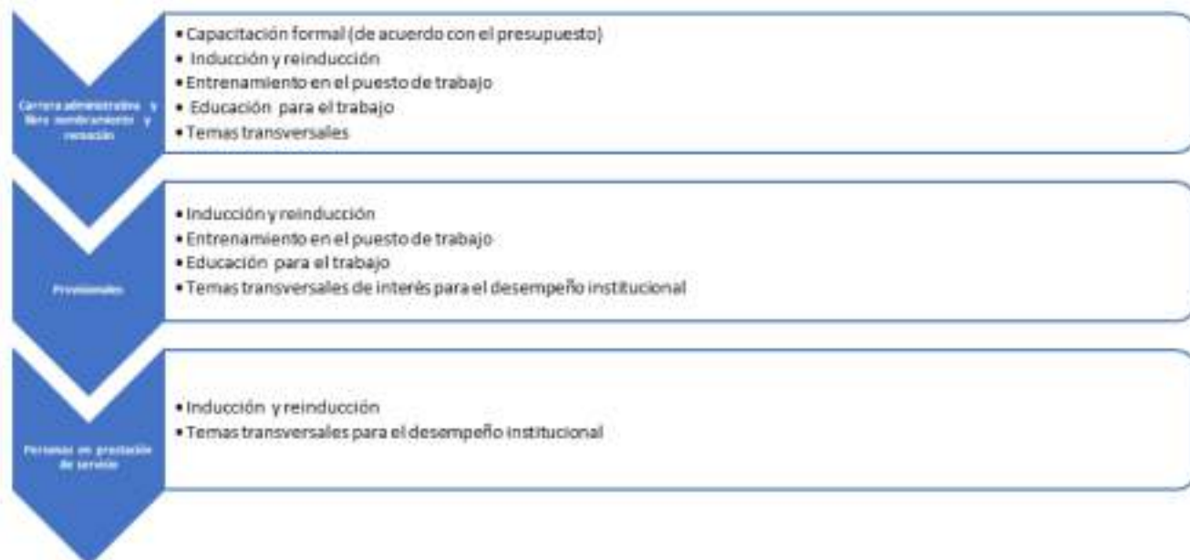
Figura 1. Acceso a actividades de capacitación de acuerdo con el tipo de vinculación

De acuerdo con la norma vigente, el Plan Institucional de Capacitación se encuentra dirigido a los servidores de carrera administrativa y libre nombramiento y remoción, y al personal militar de la Armada Nacional en comisión en la Dirección General Marítima. Sin embargo, permite la vinculación de los servidores en provisionalidad, por contrato de prestación de servicios y pasantes, a ciertos programas de capacitación.