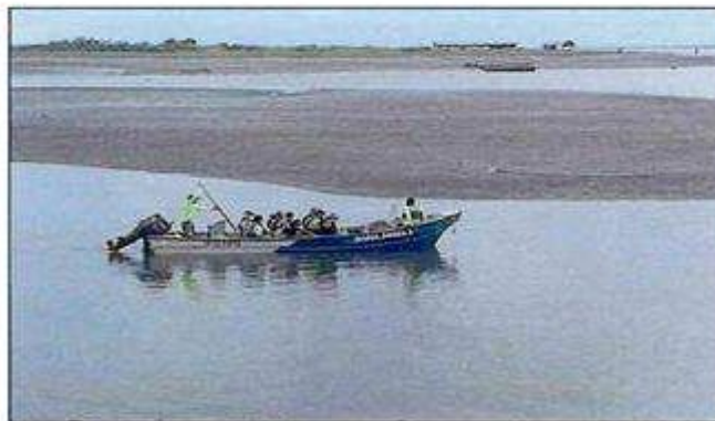
Imagen No.2 Presunta zarpe en zona no autorizada.

Aunado a lo expuesto, el responsable encargado la Sección de Estación de Control y Tráfico Marítimo de la capitanía de puerto Tumaco con señal N° 131130R manifestó lo siguiente: