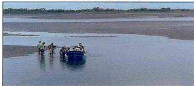
Imagen No.1 Presunto embarque en zona no autorizada.