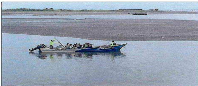
Imagen No.2 Presunto zarpe en zona no autorizada.