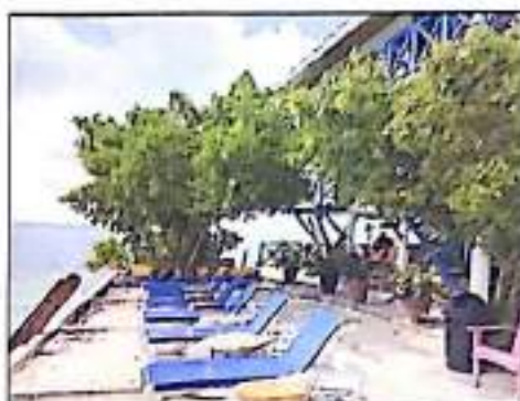
Fotos 7 y 8: Zona de sol y playa sobre el relleno y zonas verdes con presencia de especies de arbustos de mangle zaragoza