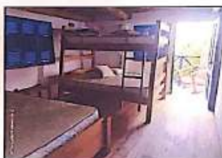
Fotos 9 y 10: Escaleras en madera y vista general de una habitación del segundo piso