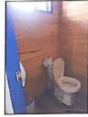
Fotos 2,3,4; Vista del Bar, sanitario y corredores en madera de la cabaña La Gaviota