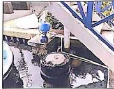
Fotos 5 y 6: Tanques de almacenamiento de aguas lluvias y sistemas de hidroflo