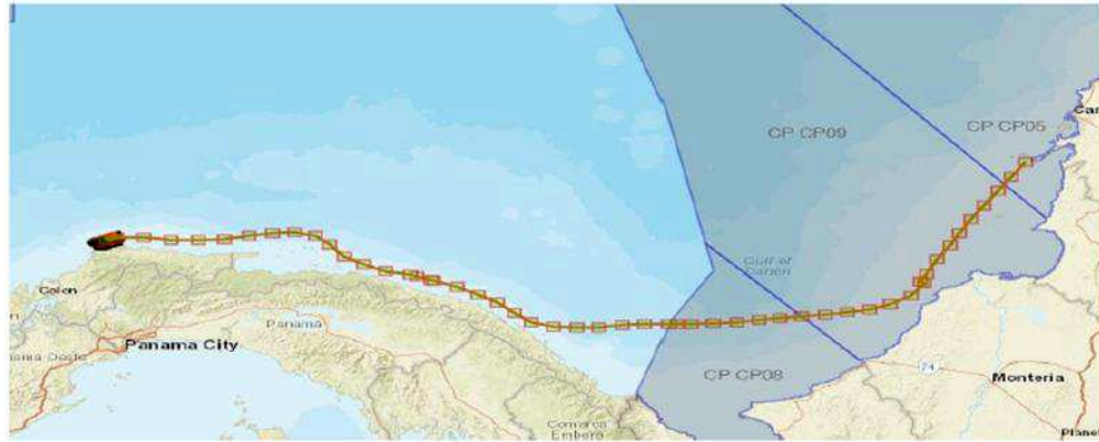
La presente imagen muestra la traza de la navegación desarrollada por la motonave PODER DE DIOS y confirma que ésta realiza navegación bordeando las costas de Panamá.

Que, recopilada todo el material probatorio necesario, el despacho procedió a formular cargos, mediante auto de fecha 27 de junio del 2023, en donde presuntamente se infringe la normatividad marítima colombiana contenida en el REMAC 4, en cuanto a lo siguiente: