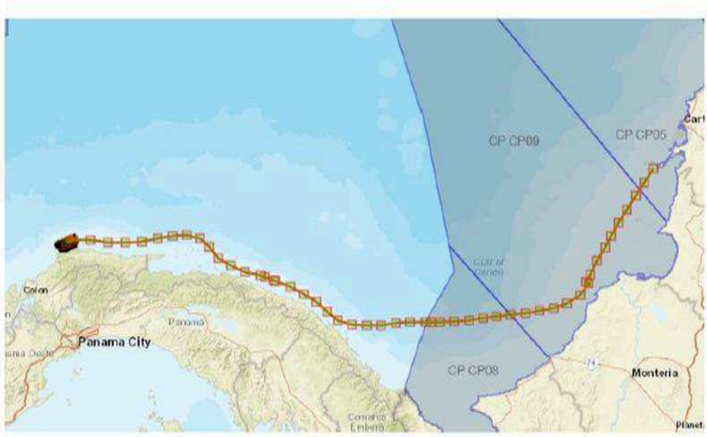
La presente imagen muestra la traza de la navegación desarrollada por la motonave PODER DE DIOS y confirma que ésta realiza navegación bordeando las costas de Panamá.