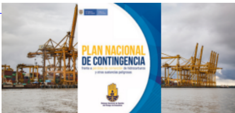
Plan Nacional de Contingencias

Es la respuesta rápida a sucesos de contaminación presentados en los mares por derrames de hidrocarburos u otras sustancias nocivas, de manera que se minimice el impacto ocasionado por aquella actuación.