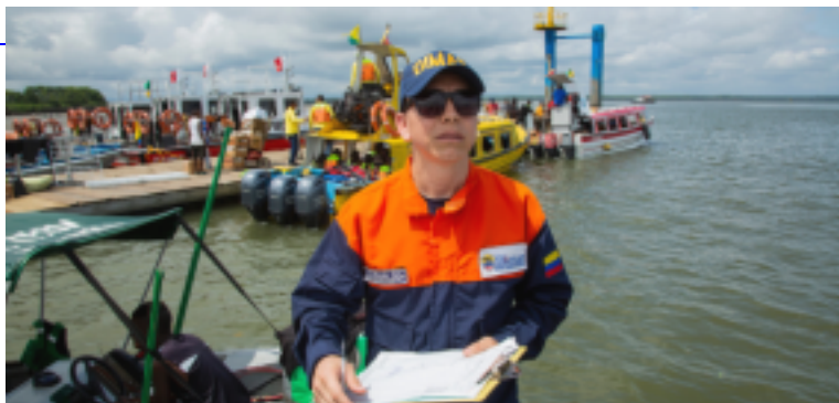
Evaluación de Riesgos