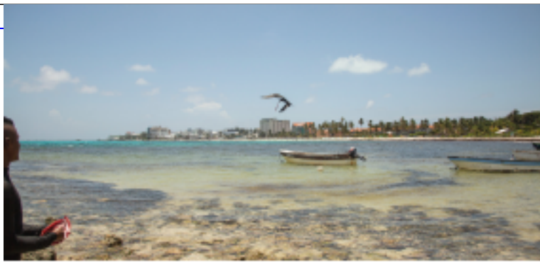
Mapas de Sensibilidad Ambiental