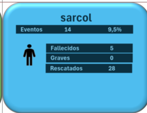
Apoyo operación búsqueda y salvamento

Informe eventos en el Territorio Marítimo Nacional