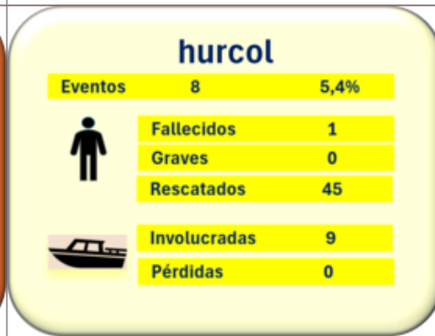
Eventos de hurtos