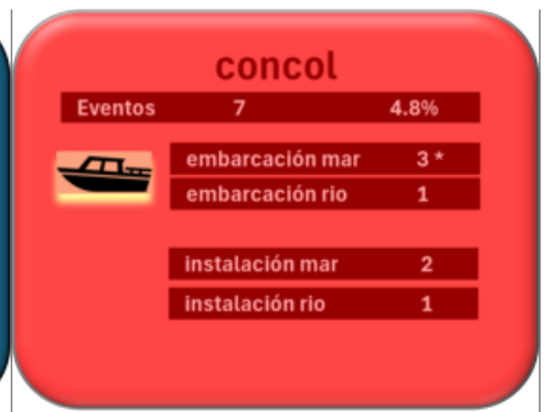
Eventos de contaminación