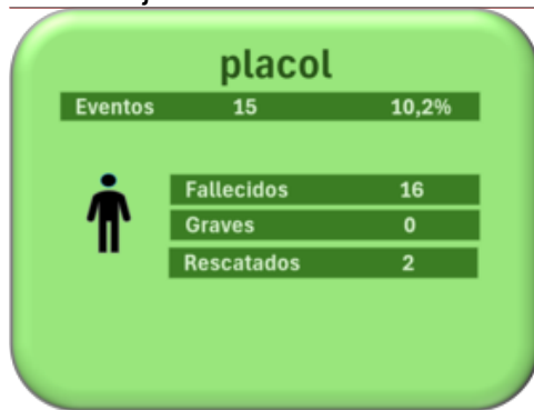
Eventos en playas