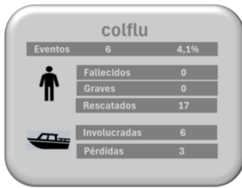
Embarcaciones territorio fluvial