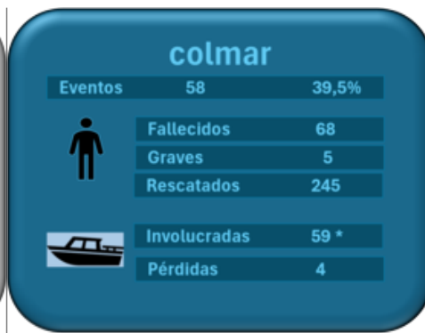
Seguridad embarcaciones nacionales territorio marítimo