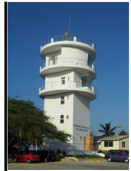
ECTM Santa Marta